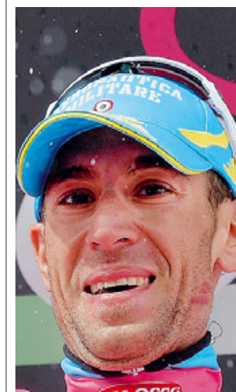
Leader Vincenzo Nibali.