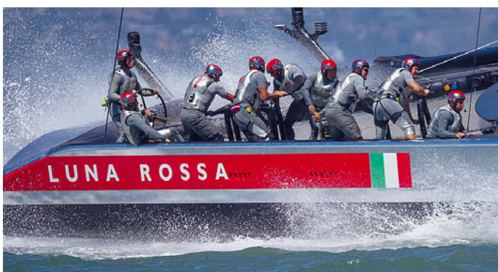
Regata Luna Rossa ha perso l'ennesima gara contro i neozelandesi.

È finita l'avventura di Luna Rossa nella Coppa America 2013. All'ottava regata della finale di Louis Vuitton Cup nella baia di San Francisco, il catamarano di Prada ha subito la settima e definitiva sconfitta ad opera dei neozelandesi di Emirates New Zealand, che si sono imposti 7-1 e che dal 7 settembre contenderanno ai detentori di Bmw Oracle la 34esima America's Cup. Nella regata di ieri, «recupero» di quella che non si era disputata il giorno precedente a causa del forte vento che batteva la baia, è andato ancora in scena il solito spettacolo, con Emirates avanti e Luna Rossa costretta a inseguire ma senza avere le doti di velocità necessarie per impensierire l'avversario, con un vento