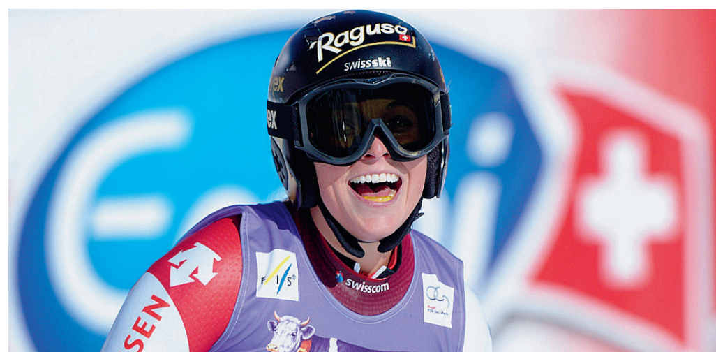
Gigante femminile La svizzera Lara Gut ha vinto la gara d'esordio della Coppa del mondo di sci.