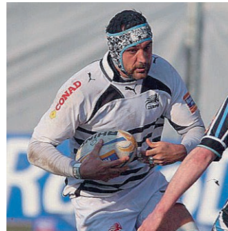
Ritorno Marco Bortolami