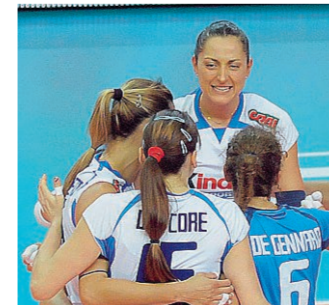
Gioia Le azzurre ieri a Bari hanno battuto il Belgio.

■ L'Italia si avvicina ancora di più alla fase finale del Mondiale conquistando tre punti che le consentono di arrivare a quota 13 in classifica, distanziando il Giappone (che ha vinto soltanto al quinto contro la Germania) di cinque lunghezze a sole due giornate dal termine del torneo. Le azzurre hanno colto la loro sesta vittoria su sette gare superando in maniera netta e meritata il